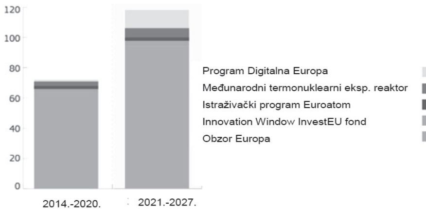
Slika 1. Planirana ulaganja EU-a u istraživanje i razvoj